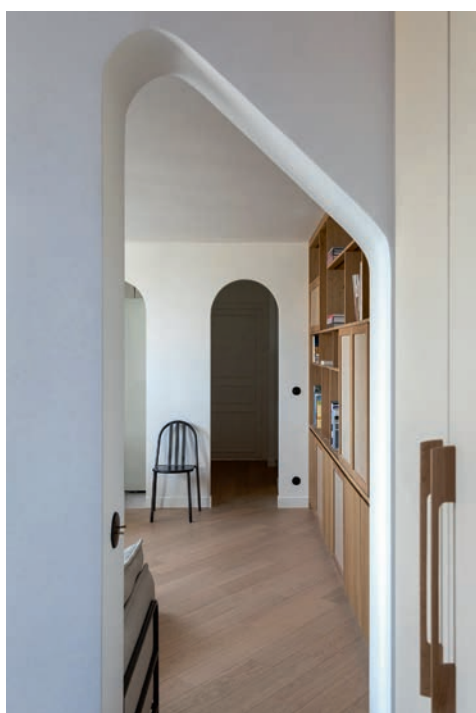
Dans le séjour, les lames du parquet ont été posées en diagonale pour donner le sentiment de repousser les murs.