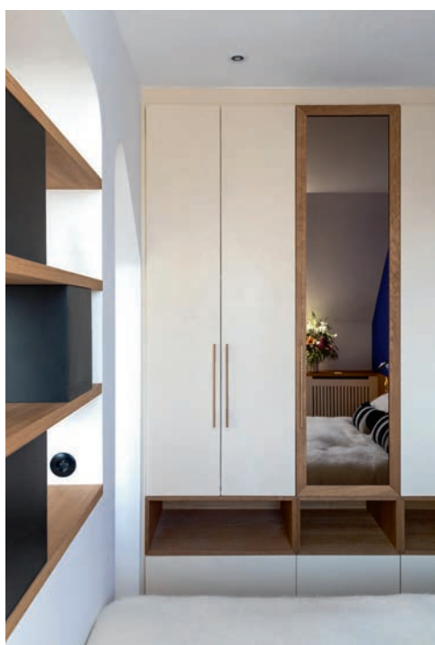
Sur mesure, le dressing présente des tiroirs en partie basse, surmontés de niches ouvertes positionnées à la hauteur du chevet, qui n'aurait pas permis l'ouverture de tiroirs ou de portes.