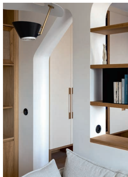
Autre couleur distillée dans l'appartement, le noir, qui recouvre luminaires, interrupteurs et niches en acier de la bibliothèque.